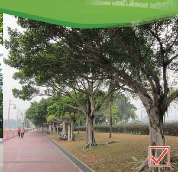
照片1和2 為求即時的綠化效果而植樹過密，長遠而言會導致樹木健康和結構欠佳