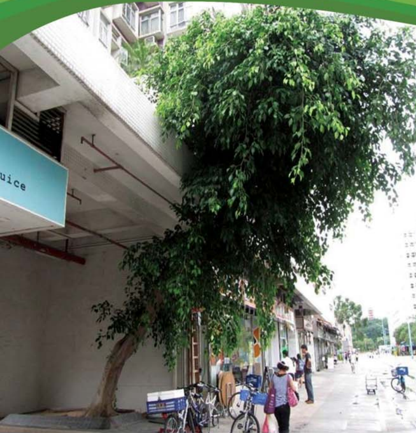
照片1 在太靠近建築物/構築物的地方種植樹木，會導致樹木外形不均稱及健康欠佳