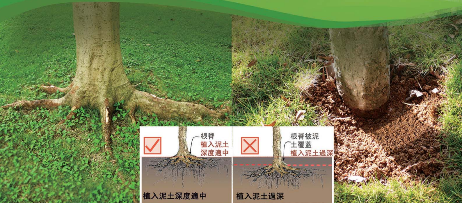
照片1 樹木植入泥土的深度若適中，應可見到根脊。