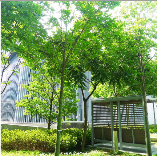
位於添馬公園的平台花園提供遮蔭 Podium planting at Tamar Park for shading