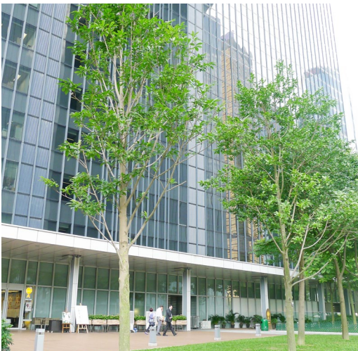
位於添馬公園的平台花園 Podium planting at Tamar Park