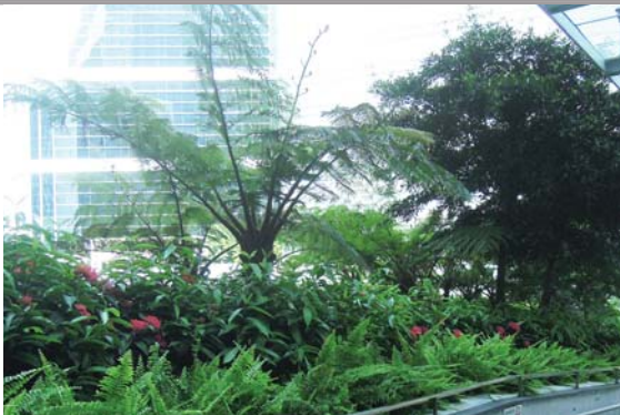
位於連接政府總部行人天橋的平台花園 Podium planting on footbridge connecting Central Government Offices