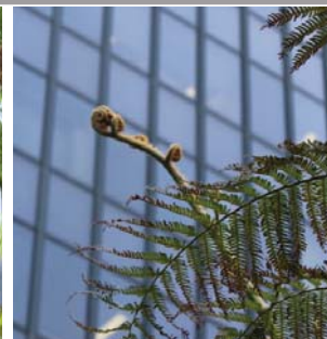
複葉的嫩芽 Growing buds of frond