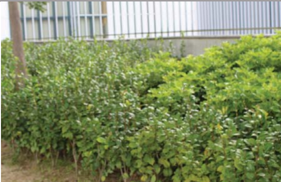
位於添馬公園的平台花園 Podium planting at Tamar Park