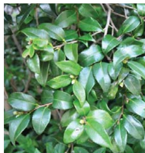
帶有蠟質的深綠色葉子 Dark green and waxy leaves