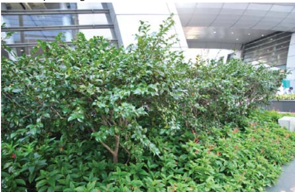
位於九龍站的平台花園 Podium planting at Kowloon Station