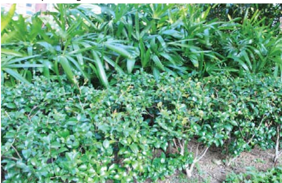
位於九龍站的平台花園 Podium planting at Kowloon Station