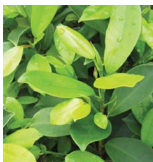
葉叢在陽光下變成金色 Foliage turns golden under intense sunlight