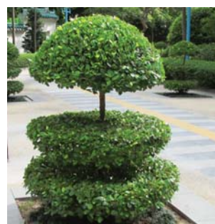
可修剪作剪形樹 Suitable for pruning as topiary plant