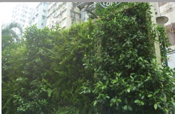
位於旺角的垂直綠化 Vertical greening at Mong Kok