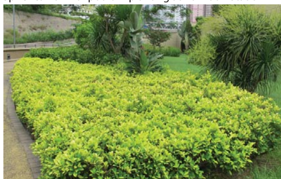
位於荔枝角公園的平台花園 Podium planting at Lai Chi Kok Park