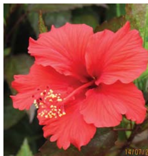
全年開花的大紅花 Flowering all year round