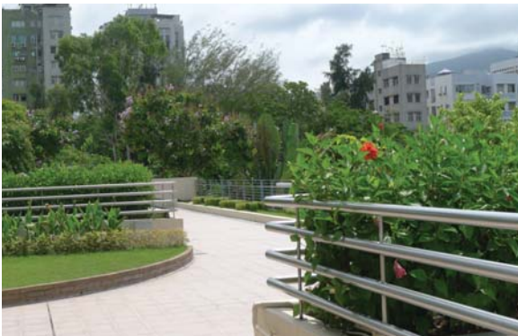
位於西貢海濱公園建築物的屋頂綠化 Green roof on building at Sai Kung Promenade