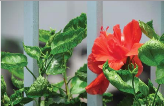
位於添馬公園的平台花園 Podium planting at Tamar Park