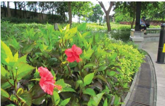
位於荔枝角公園的平台花園 Podium planting at Lai Chi Kok Park