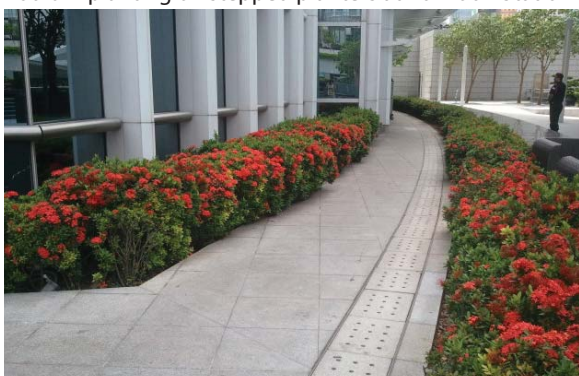
位於國際金融中心的平台花園 Podium planting at International Finance Centre