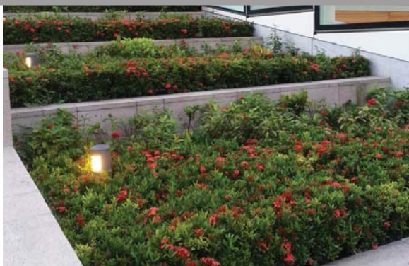
位於九龍站的平台花園 Podium planting at Kowloon Station