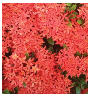
燦爛濃密的花朵 Dense and showy flowers