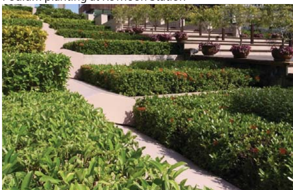
位於九龍站平台花園的階梯式花槽 Podium planting on stepped planters at Kowloon Station