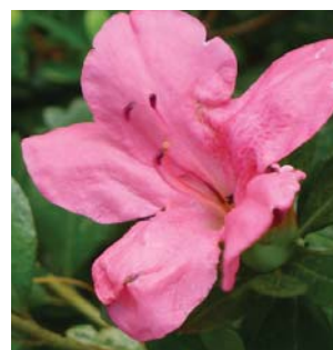
春天會開燦爛的花朵 Magnificent, showy blossoms in Spring