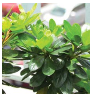
細緻及有毛的葉片 Fine textured and leathery leaves