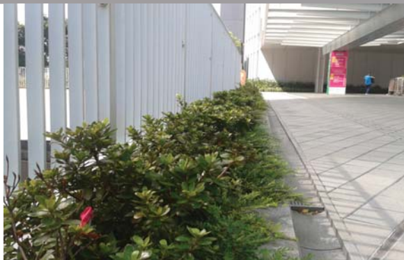
位於添馬公園行人天橋的平台花園 Podium planting on footbridge at Tamar Park