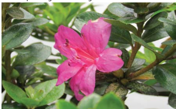
位於添馬公園平台花園的艷麗花朵 Colourful blossoms at podium planting of Tamar Park