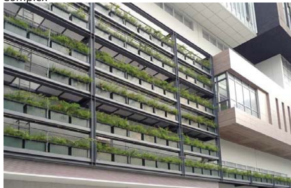
位於西貢將軍澳政府綜合大樓的垂直綠化 Vertical greening at Sai Kung Tseung Kwan O Government Complex