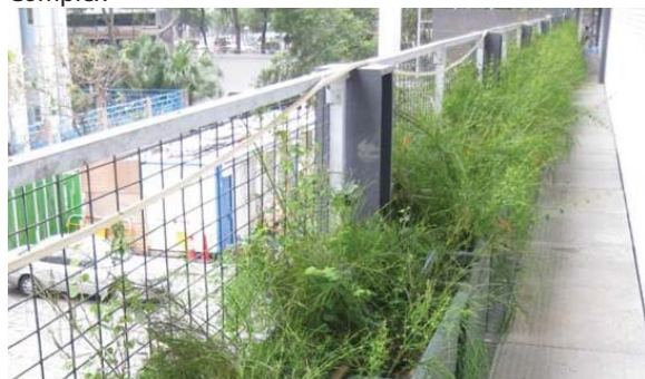
種植於層架式花槽以作垂直綠化 Planting in stack planters for vertical greening