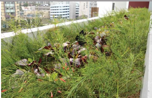
位於西貢將軍澳政府綜合大樓的平台花園 Podium planting at Sai Kung Tseung Kwan O Government Complex