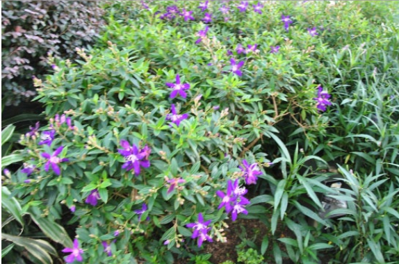
位於九龍站的平台花園 Podium planting at Kowloon Station