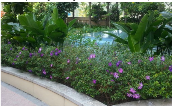
位於大嶼山屋苑的平台花園 Podium planting at Lantau residential development