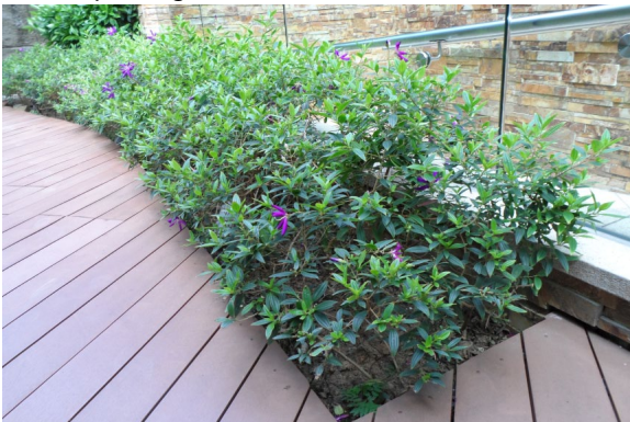
位於紅磡屋苑的平台花園 Podium planting at Hung Hom residential development