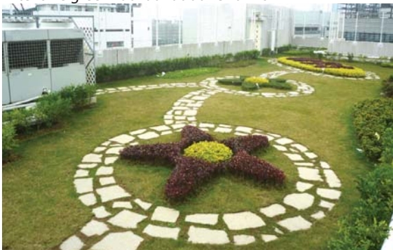
位於嘉諾撒聖家學校的粗放型屋頂綠化 Extensive green roof at Holy Family Canossian School