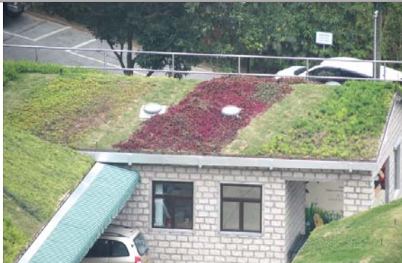
位於嘉道理農場的粗放型屋頂綠化 Extensive green roof at Kadoorie Farms