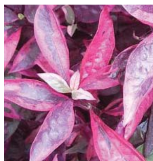
深紫紅色的葉 Deep scarlet leaves