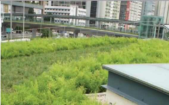
位於渠務署設施的粗放型屋頂綠化 Extensive green roof on Drainage Services Department's facility