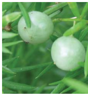
綠色的果成熟時會轉為紅色 Green berries turn red in maturity