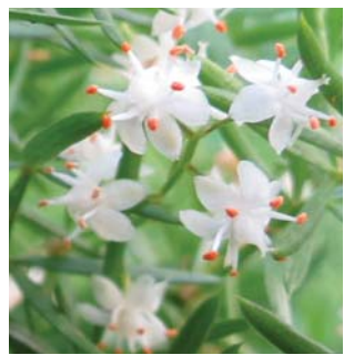
白色的小花 Little white flowers