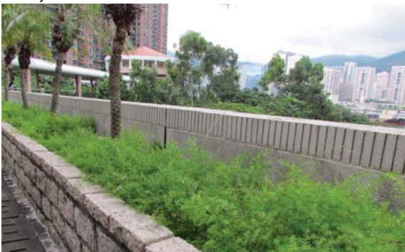
位於青衣屋苑的平台花園 Podium planting at Tsing Yi residential development