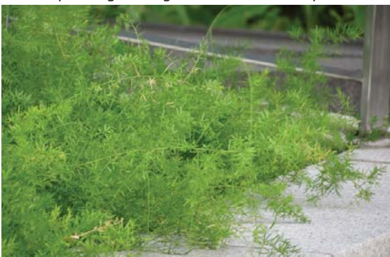
位於尖沙咀公共運輸交匯處的平台花園 Podium planting at Tsim Sha Tsui Public Transport Interchange