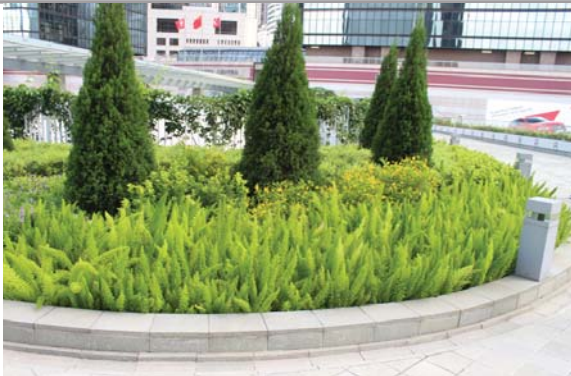
位於添馬公園的平台花園 Podium planting at Tamar Park