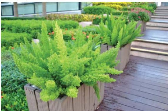
位於九龍站的平台花園 Podium planting at Kowloon Station