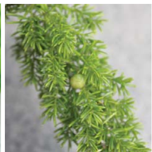
綠色的果成熟時會轉為紅色 Green berries turn red in maturity