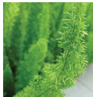
青綠色的針狀葉 Cyan needle-like leaves