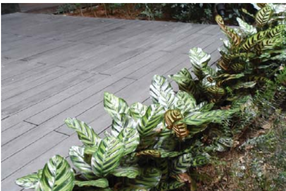
位於紅磡屋苑的平台花園 Podium planting at Hung Hom residential development