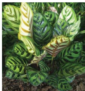
叢生的特性 Clump-forming nature