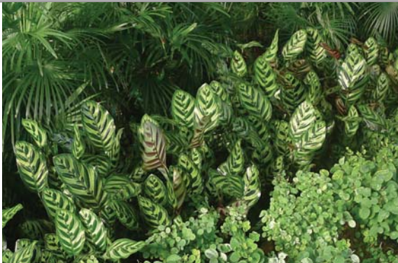
位於添馬公園的平台花園 Podium planting at Tamar Park