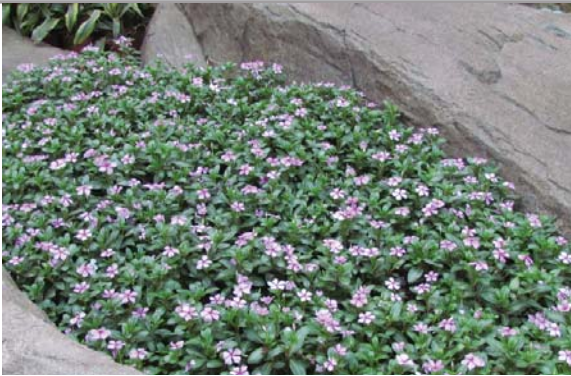
位於長江公園的平台花園 Podium planting at Cheung Kong Park