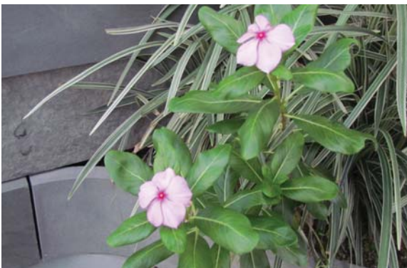
位於太古廣場的平台花園 Podium planting at Pacific Place