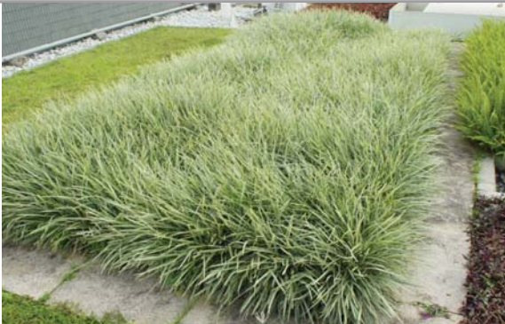
位於渠務署設施上的粗放型屋頂綠化 Extensive green roof at Drainage Services Department's facility