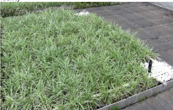
位於西貢將軍澳政府綜合大樓的粗放型屋頂綠化 Extensive green roof at Sai Kung Tseung Kwan O Government Complex