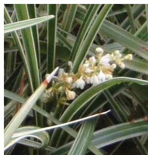
白色的圓錐花叢 White panicle of flowers