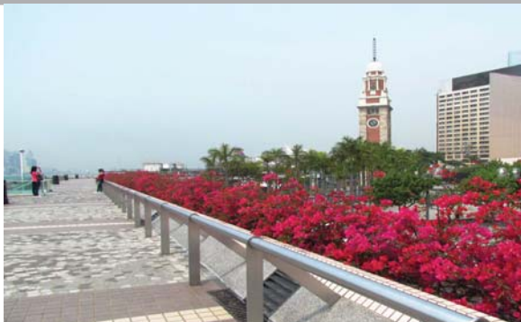
位於尖沙咀海濱的平台花園 Podium planting at Tsim Sha Tsui Waterfront