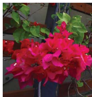
色彩鮮艷的苞片 Colorful bracts