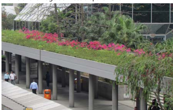
位於灣仔政府大樓有蓋行人通道的屋頂綠化 Green roof on covered walkway outside Wanchai Tower