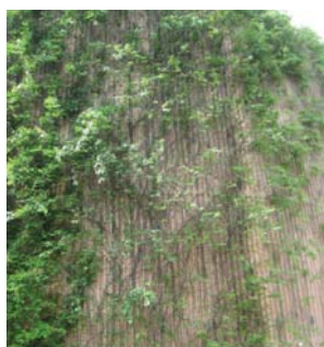
以金屬網作攀緣植物的支撐 Climbing with wire mesh support