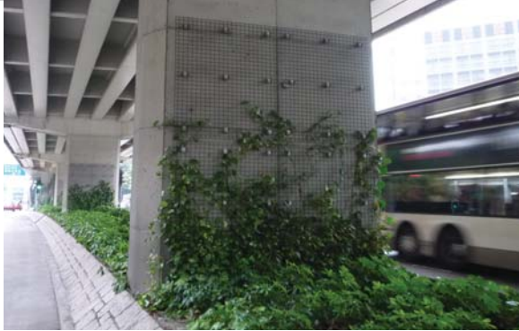
位於行車天橋支撐柱的垂直綠化 Vertical greening on columns underneath fly-over