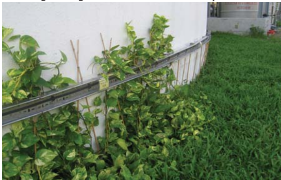
位於沙田污水處理廠以支撐方法進行垂直綠化 Vertical greening with support at Sha Tin Sewage Treatment Works