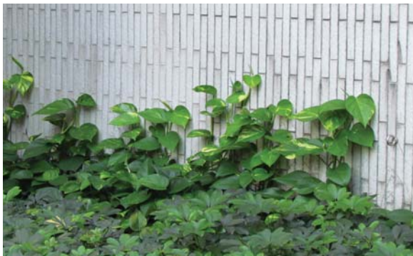
自行攀緣於太古廣場的外牆上 Self clinging on wall at Pacific Place