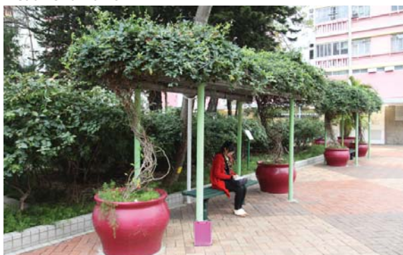
於房屋署的項目用作陰棚植物 Planting on shelters at Housing Department's project