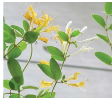
芳香的黃色及白色花 Scented yellow and white flowers