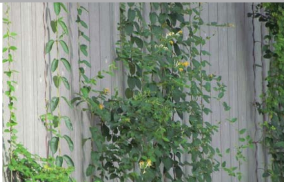
位於政府總部以鋼線作支撐的垂直綠化 Planting with wire support at Central Government Offices