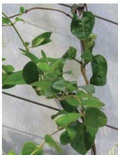
纏繞的習性 Twining habit