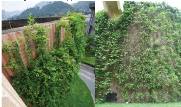
位於沙田污水處理廠以金屬網作支撐的垂直綠化 Vertical greening on metal mesh at Sha Tin Sewage Treatment Works