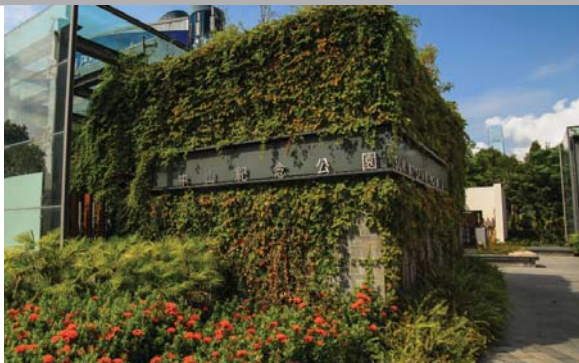
位於中山紀念公園的垂直綠化 Vertical greening at Sun Yat Sen Memorial Park