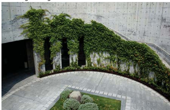
位於鑽石山火葬場的垂直綠化 Vertical greening at Diamond Hill Crematorium