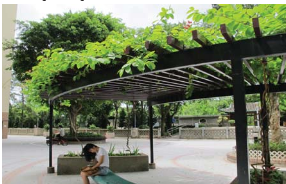
位於美孚新村作陰棚植物 Planting on a shelter for shading in Mei Foo Sun Tsuen