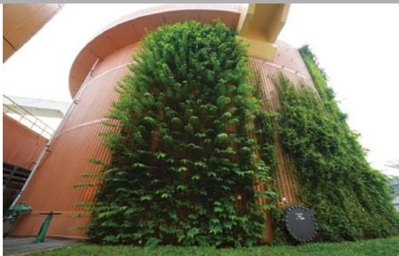
位於沙田污水處理廠的垂直綠化 Vertical greening at Sha Tin Sewage Treatment Works