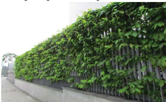
位於行政長官辦公室圍欄的垂直綠化 Vertical greening on fence wall at Chief Executive's Office