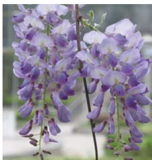
奪目的紫藍色花朵 Showy, lavender blue ornamental flowers