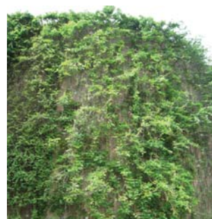
夏天的濃密葉叢 Dense foliage in summer