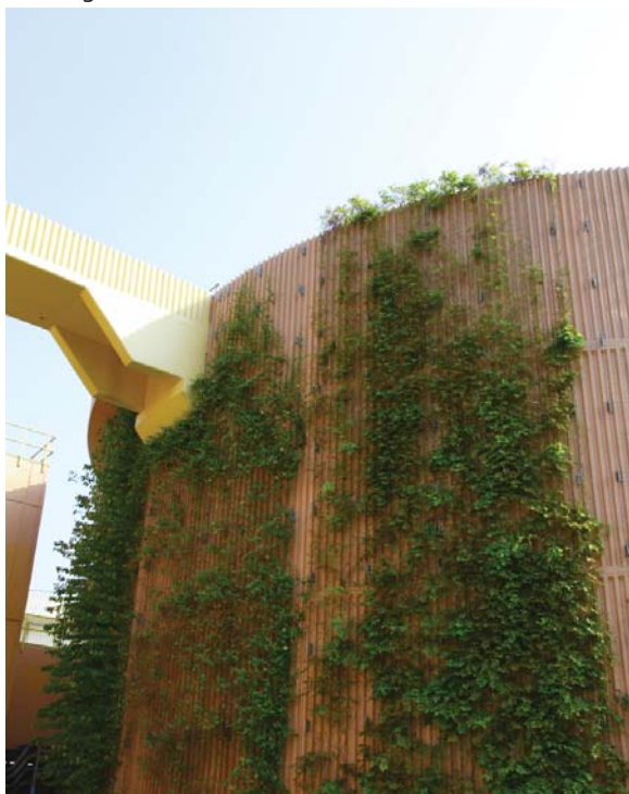
位於沙田污水處理廠的垂直綠化 Vertical greening at Sha Tin Sewage Treatment Works