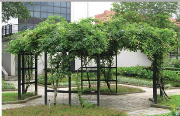
作陰棚植物 Planting on shelter