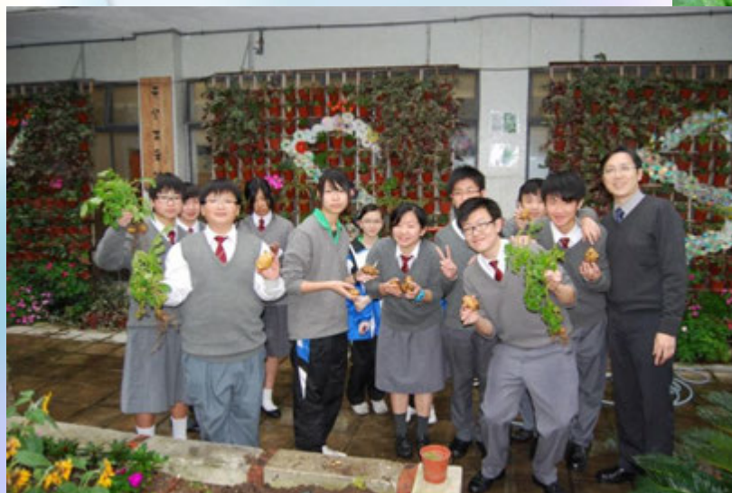
馬鈴薯豐收，園藝 組師生合照