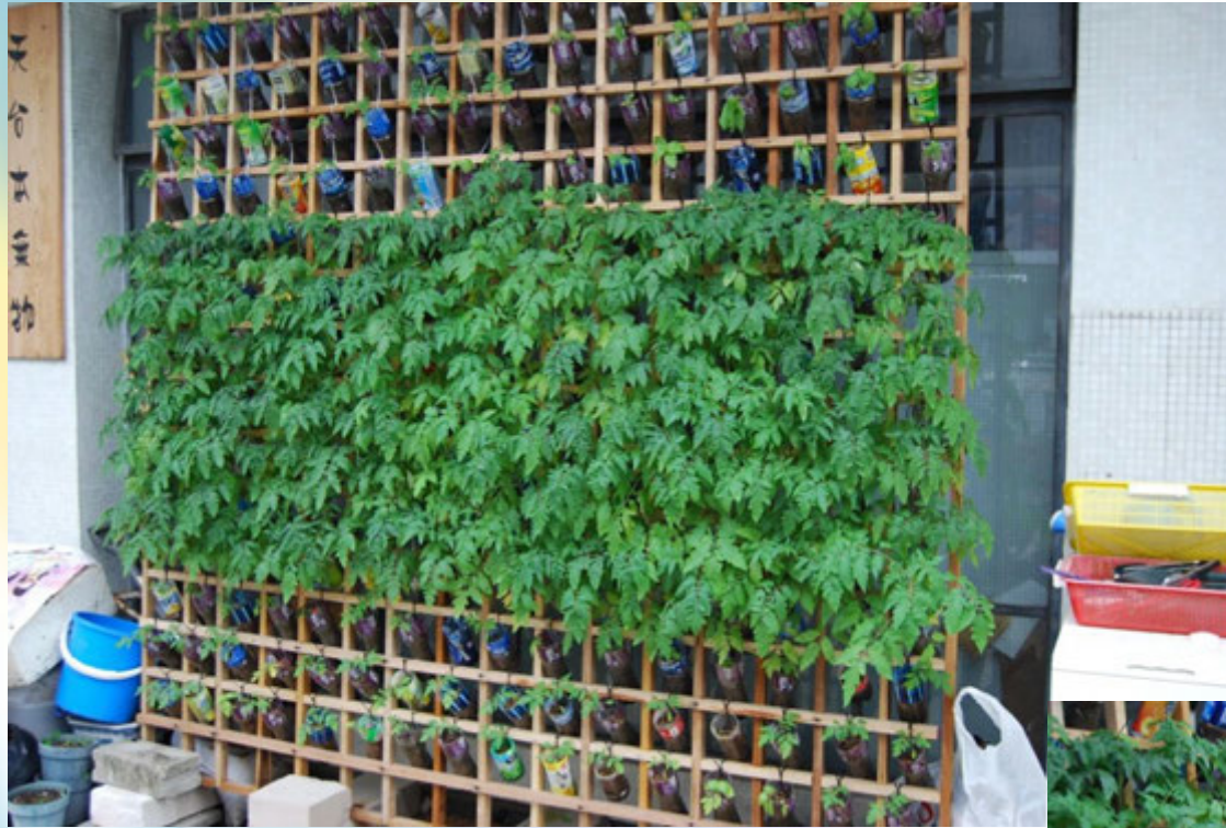
首批試驗綠牆 種植的番茄幼 苗茁壯生長。