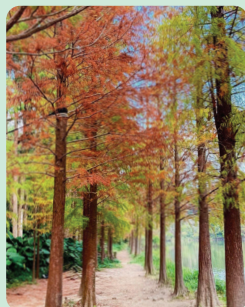
B 落羽杉 (賞葉: 秋冬) Taxodium distichum (Bald Cypress)

原產自北美洲，能在低窪及沼澤中存活。落羽杉的木質多孔，使氧氣能夠擴散到韌皮部並為根部疏氣，根部亦能進化出「呼吸根」來協助自身在無氧環境中生存。落葉時，猶如羽毛在風中起舞，故名落羽杉。