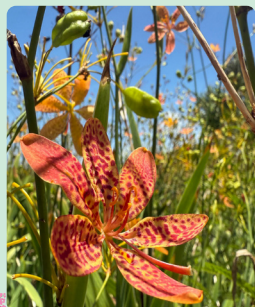
C 射干 (花期: 春夏) Belamcanda chinensis (Black-berry Lily)

原產自北美洲，能在低窪及沼澤中存活。落羽杉的木質多孔，使氧氣能夠擴散到韌皮部並為根部疏氣，根部亦能進化出「呼吸根」來協助自身在無氧環境中生存。落葉時，猶如羽毛在風中起舞，故名落羽杉。