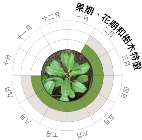
果期 花期 葉片變化